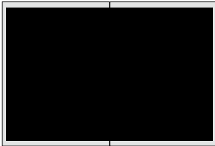
2/1-Seite 400 x 275 mm Hochformat

Grundpreis(4c): 2.950 EUR Direkt-/Ortspreis 2.500 EUR